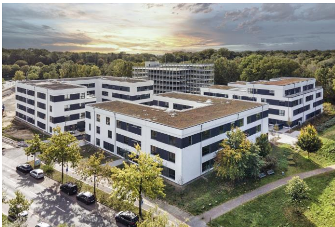
Bild 3b_ Geschäftsbereich Industrie- und Gewerbebau

Ein- und Zweifamilienhäuser stehen 57% Anteil am Umsatz des Unternehmens für das Hauptgeschäft von Haas Fertigbau. Jährlich plant, produziert und erreicht Haas 450-500 Ein- und Zweifamilienhäuser für Kunden in Deutschland, Österreich und Tschechien.