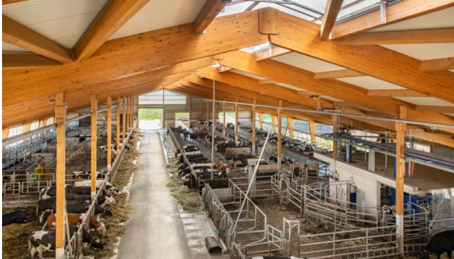
Bild 3c_ Geschäftsbereich Landwirtschaftsbau