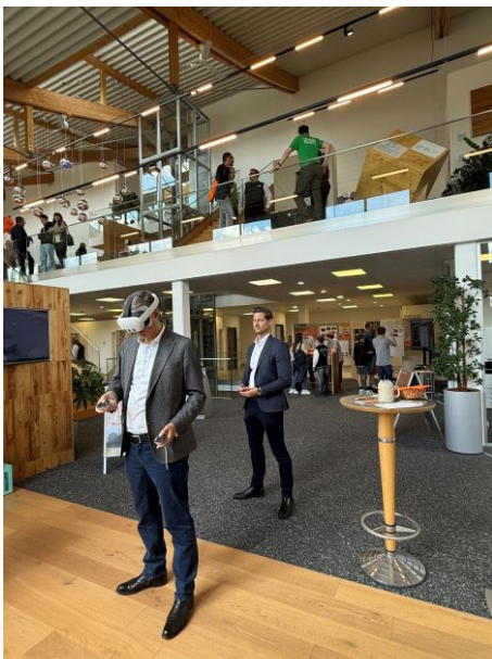
Bild 5d_Persönliche Beratung mit moderner Technik

Auf 3.000 m 2 Fläche können sich Kunden inspirieren lassen und ihre Projekte nach den ganz persönlichen Bedürfnissen bezüglich Designs, Komfort, Technik und Sicherheit verwirklichen. Ein modernes Ambiente bietet das Haas Kundenforum Interessenten und Kunden, um sich in allen Fragen rund um das Thema Bauen umfassend und kompetent beraten zu lassen und die individuellen Ausstattungsdetails festzulegen, die jedes Haas Haus schließlich zum ganz individuellen Zuhause jedes Bauherrn macht.