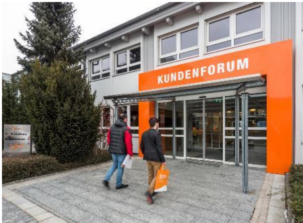
Bild 5a_ Kundenforum Falkenberg