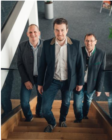
Bild 2a_ Geschäftsführung Haas Group