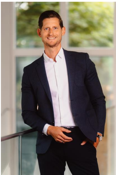
Bild 2b_ Geschäftsführung Haas Group