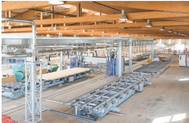
Bild 6a_ Wandlinie im Werk Falkenberg