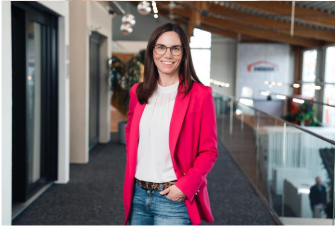
Bild 2c_ Geschäftsführung Haas Group und Haas Fertigbau