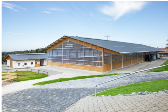
Bild 3d_ Geschäftsbereich Landwirtschaftsbau/Reitanlagen

Die Wurzeln von Haas liegen in der Realisierung von Hallen und Ställen für die Landwirtschaft. Heute steht der Landwirtschaftsbau für 22% der Haas Gruppenleistung.