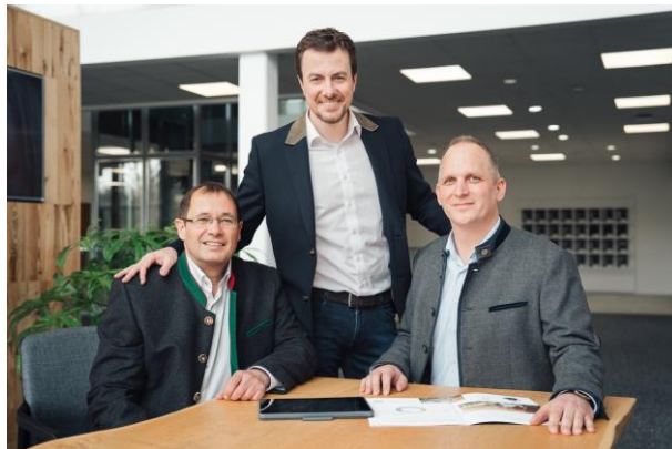
Bild 2j_ Die Geschäftsführung von Haas Fertigbau in Falkenberg

Geschäftsführer Vertrieb und Marketing – Haas Baumanagement GmbH