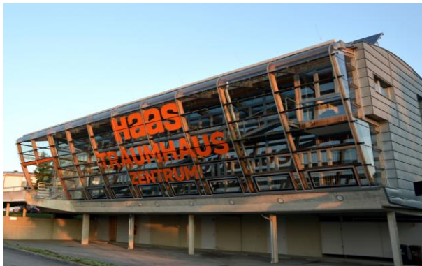
Bild 5b_ Haas Traumhauszentrum Großwilfersdorf

Das Haas Kundenforum ist täglich für Interessierte und Kunden geöffnet. Die Öffnungszeiten sind online unter https://www.haas-fertigbau.de/unternehmen/haas-vor-ort abrufbar.