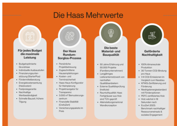
Bild_ Haas Mehrwerte

Die Haas Firmenzentrale im niederbayerischen Falkenberg