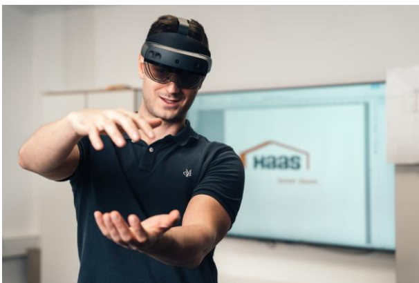
Bild 6b_ digitale Baustellenabwicklung

Die Wandelemente werden witterungsgeschützt auf einer automatisierten Wandlinie produziert und verlassen bereits in einem hohen Maße vorgefertigt das Werk. Deshalb ist Fertigbau nicht nur sicherer und schneller, sondern dank industrieller Qualitätsstandards inklusive interner und externer Audits auch besser als eine herkömmliche Erledigung aller Schritte auf der Baustelle.