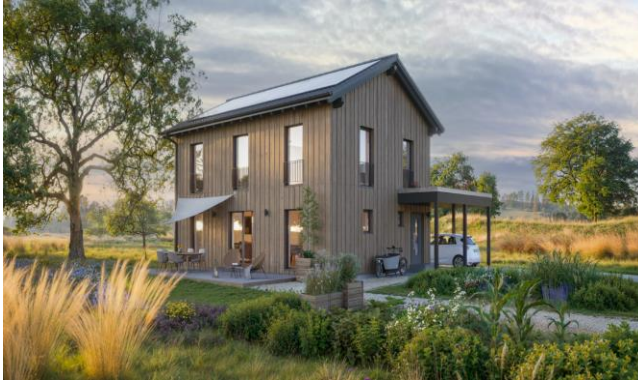
Bild 3a_ Geschäftsbereich Hausbau