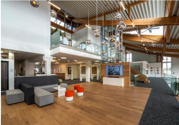
Bild 5c_ Kundenforum 2