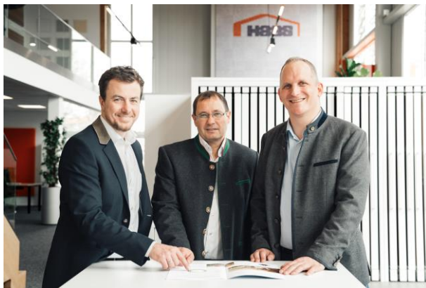
Bild 2d_ Die Geschäftsführung von Haas Fertigbau in Falkenberg